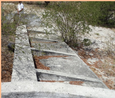
Modelo de sangradouro