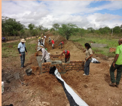
Construção do sangradouro e do poço