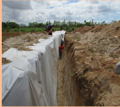
Construção da parede