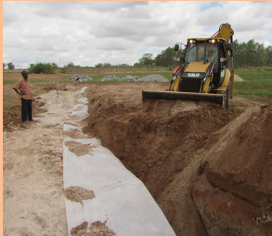
Fechamento da vala