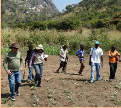
Seleção do local