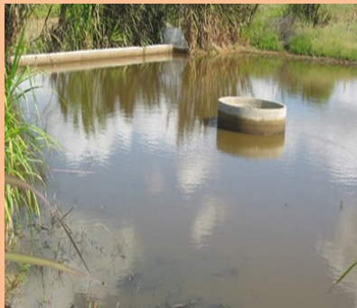
Barragem subterrânea após primeiras chuvas